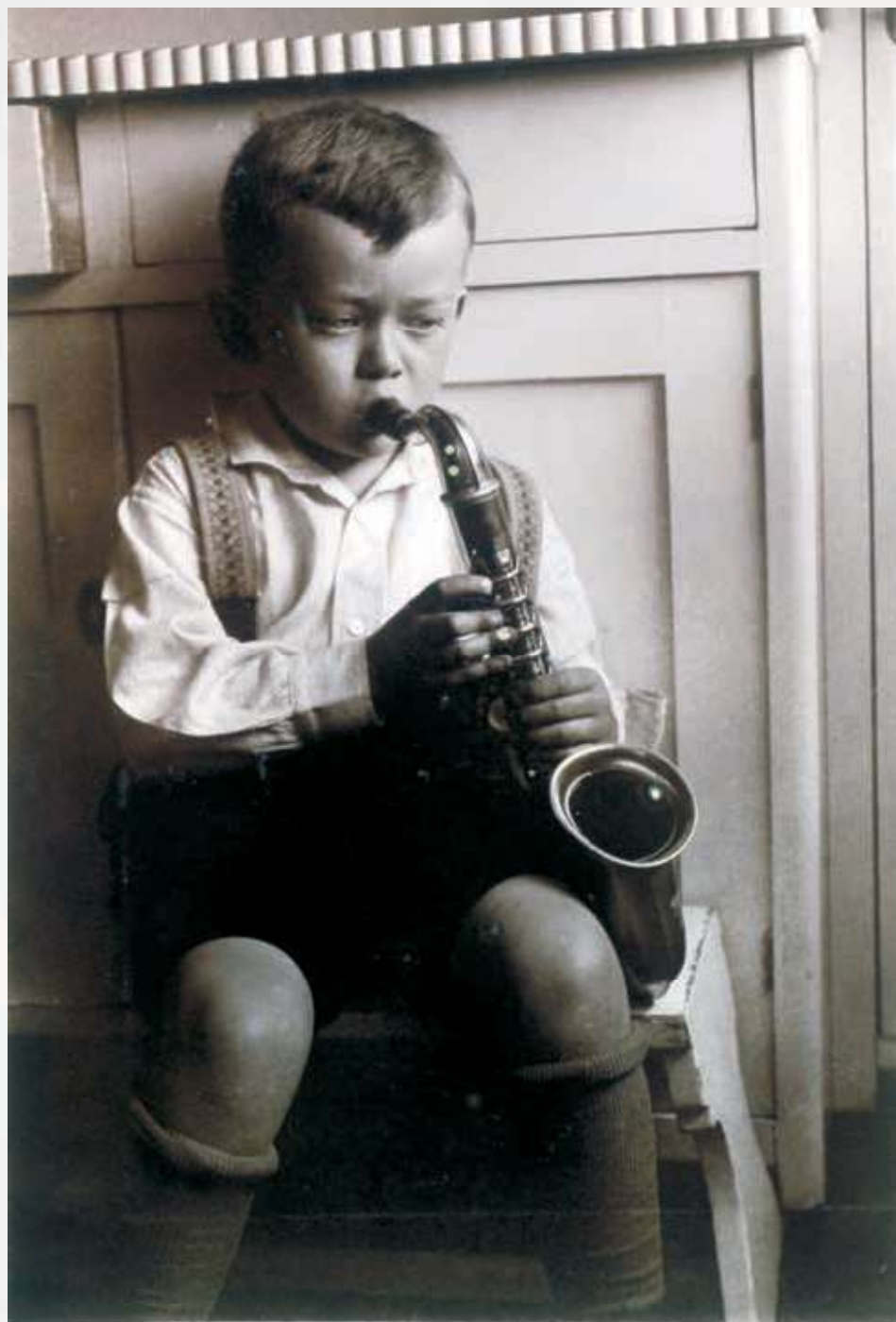
Josef Škvorecký se svým prvním saxofonem (duben 1930)