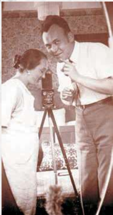
Těhotná maminka s tatínkem (1924)