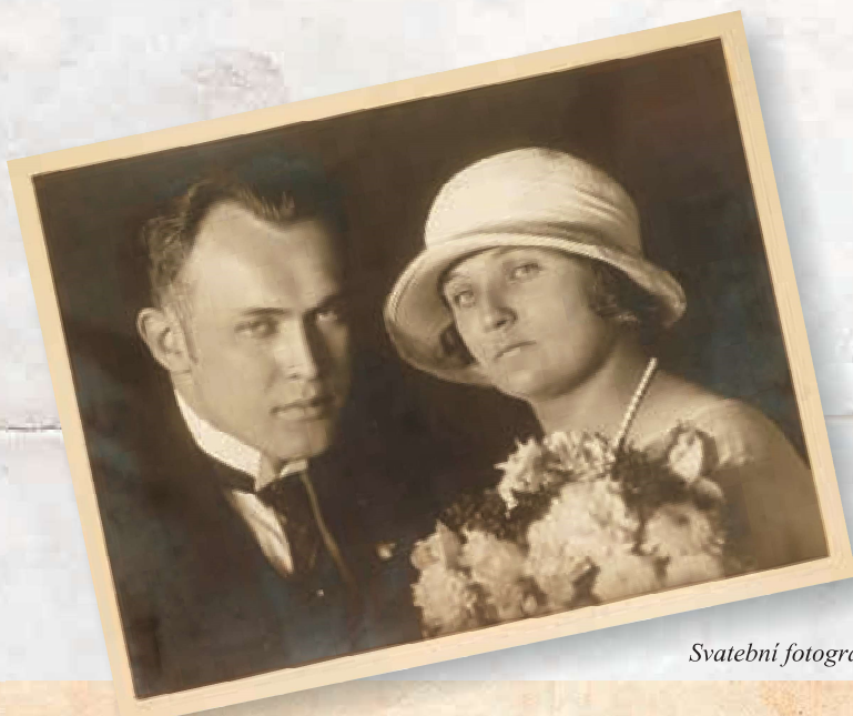
Svatební fotografie rodičů (1923)